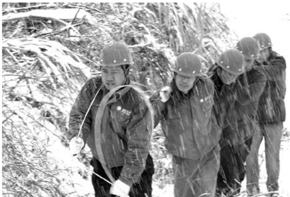
安徽宣城供电公司水东供电所员工冒着大雪抢修线路。