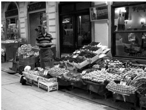
土耳其商业发达，图为土耳其街头水果零售商贩。

产总值的 60% 左右，其中金融、电信、旅游、交通等行业发展较突出。工业产值约占国内生产总值的 30%，主要工业部门有纺织服装、钢铁、汽车、水泥、机械制造等。旅游业是土耳其除商品出口外最大的外汇收入来源，每年到土耳其旅游的境外游客超过 2000 万人次。