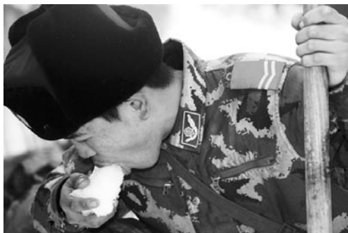
一名武警战士在京珠高速公路破冰铲雪间隙用冰解渴。

雪中送炭显真情，各省区市大力援助受灾严重的兄弟省份。江苏在奋力抗灾自救的同时，给湖南、湖北、贵州、江西和安徽五省各捐款200万元，援助14辆大型应急发电车。广东电网公司半个月先后组织