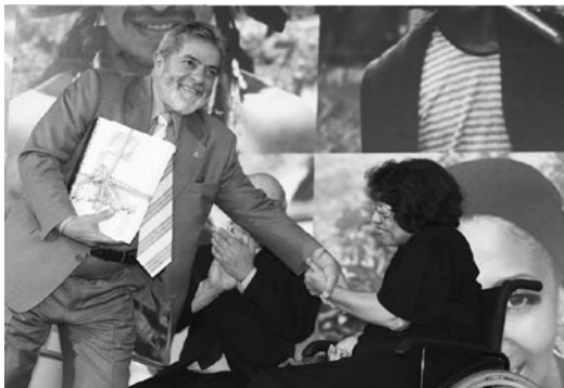
巴西总统卢拉着力推动以“社会发展”为核心的发展模式，并大力救助贫困人口。图为卢拉（左）在总统府举行的助残计划启动仪式上与残疾人代表握手。

第三，金砖四国的崛起不但没有威胁其他国家，而且为其他国家的发展提供了新的机遇，为世界经济的均衡稳定增长提供了新的动力，成为重要的平衡力量。美国的次级债危机和股市下滑使人们担心世界是否会进入衰退。中国银监会主席刘明康提供的一组金砖四国的股市数据——从2003年初到2007年11月底，俄罗斯的股票指数上涨631%，印度上涨596%，巴西上涨576%，而中国A股上证综指上涨的幅度最小，也高达325%——有力地证明了金砖四国蓬勃发展的经济正在相当大的程度上抵消了美国经济萧条的负面影响，成为世界经济健康发展的新动力源和积极的平衡力量。