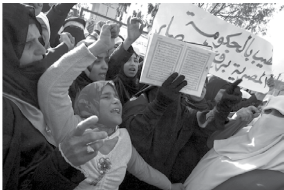
2月3日，埃及重新封闭了拉法口岸。图为2月2日巴勒斯坦妇女在加沙地带南部抗议埃及重新关闭该口岸。

国际同情和支持只是暂时的，无法彻底摆脱困境。在美国的默许下，以色列随时可以加大对加沙的封锁力度。推翻哈马斯政权，是美以的最终目标。此外，哈马斯此举得罪了埃及。事件不仅使埃及边境安全受到了严重挑战，还把埃及推到了两难境地：阻止加沙居民越境，有违人道；允许他们进入，势必招致美以不满。看来，哈马斯今后要想借重埃及